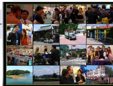
Interface de Rede